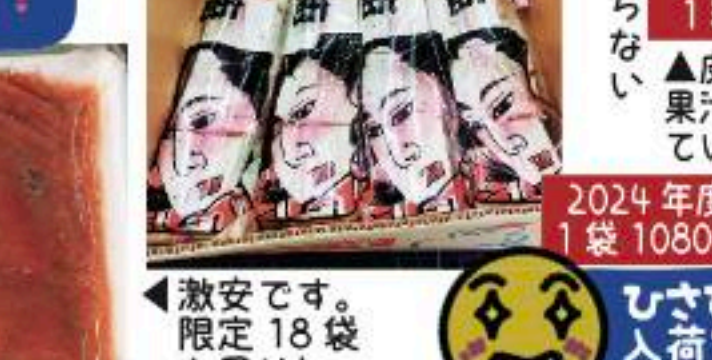
2024年度干しもち 1袋 1080円 (1167円)