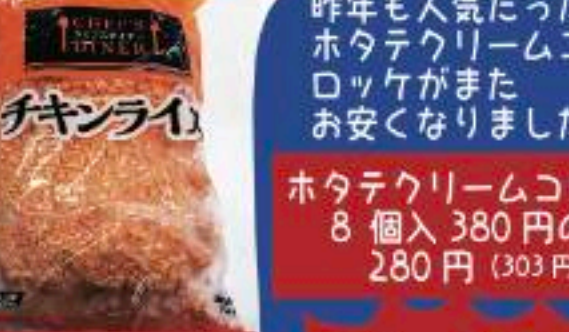
冷凍チャーハン 冷凍チキンライス 1kg入各1袋 480円の品 400円 (432円)