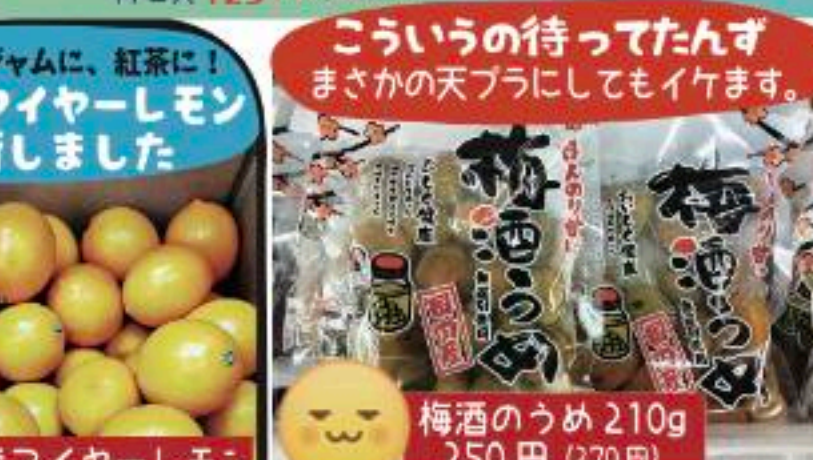
三重県産マイヤーレモン 2コ 158円 (171円)