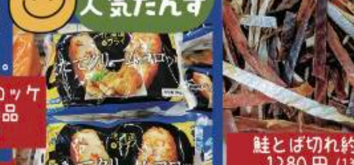
鮭とば切れ約 500g 1280円 (1383円)