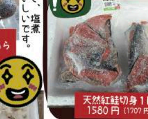
天然紅鮭切身 1kg 1580円 (1707円)