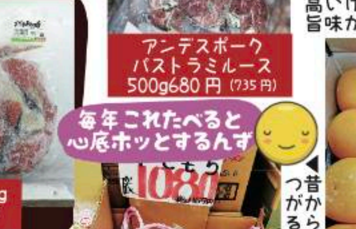
アンデスポーク パストラミルス 500g 680円 (735円)