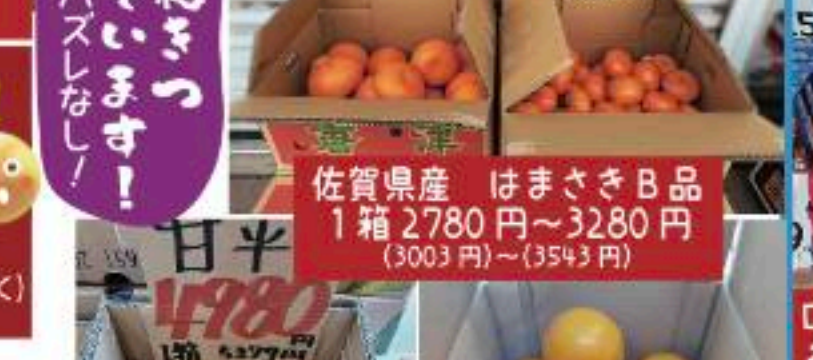
佐賀県産 はまさき B品 1箱 2780円~3280円 (3003円)~(3543円)