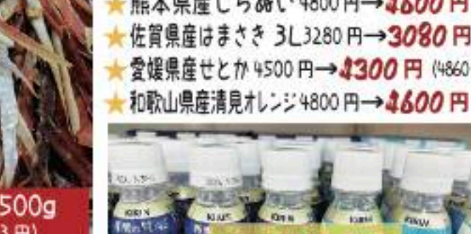
トルコ産グレープフルーツB品 2800円→2600円 (2808円) | アメリカ産メロゴールドB品 3800円→3600円 (3888円) | 鹿児島県産紅甘夏 2300円→2100円 (2268円) | 熊本県産しらめい 4800円→4600円 (4968円) | 佐賀県産はまさき 3L 3280円→3080円 (3327円) | 愛媛県産せとか 4500円→4300円 (4860円) | 和歌山県産清見オレンジ 4800円→4600円 (4968円)