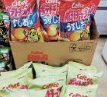
カルビーのポテトチップス 各1袋 78円 (85円)