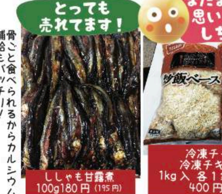
ししゃも甘露煮 100g 180円 (195円)