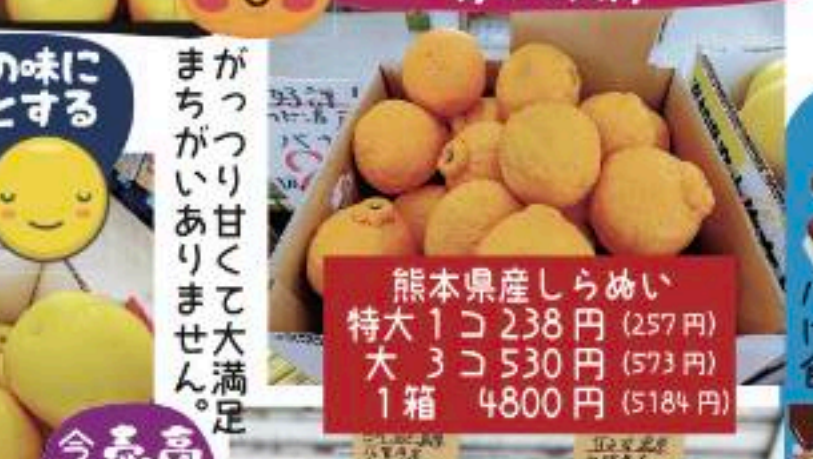
熊本県産しらめい 特大 1コ 238円 (257円) | 大 3コ 530円 (573円) | 1箱 4800円 (5184円)