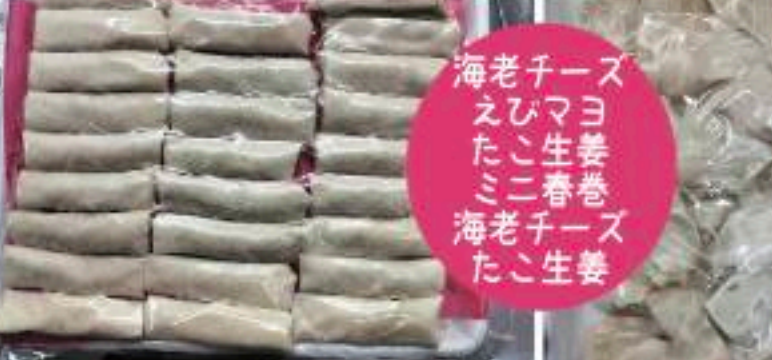
業務用 一口ぎょうざ 500g 450円 (486円)