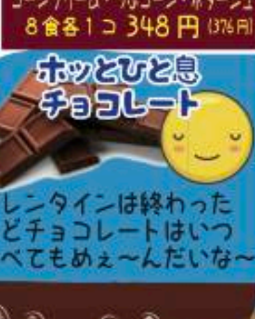
バレンタインは終わったけどチョコレートはいつ 食べてもめえ~んだいな~