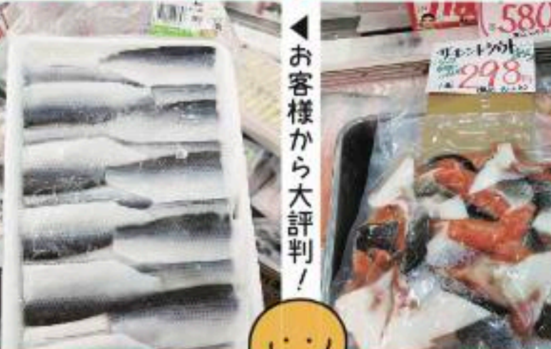
業務用 小肌の酢じめ 1パック 780円の品 680円 (735円) | 100袋限定 サーモントラウトあら 1袋 298円 (322円)