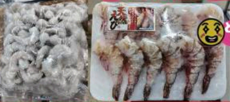
ベトナム産向きバナメイえび 330g 450円 (486円) | インド産ホワイトえび 12尾入 450円 (486円)