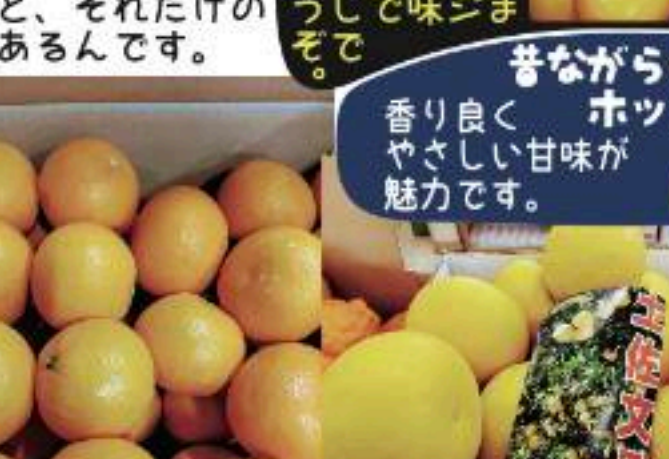
和歌山県産清見オレンジ 1箱 4800円 (5184円)