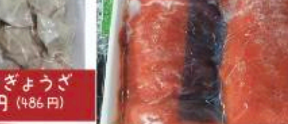
業務用 一口ぎょうざ 500g 450円 (486円)