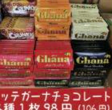
ロッテガーナチョコレート 各種 1枚 98円 (106円)